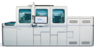
cobas ® 8800 System