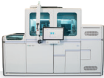
cobas ® 6800 System

Die cobas ® 6800 / 8800 Systeme liefern zuverlässige Testergebnisse in sehr kurzer Zeit