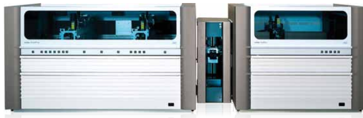
COBAS® AmpliPrep Instrument