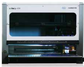
cobas p 630 Instrument