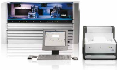
COBAS® AmpliPrep / COBAS® TaqMan® 48