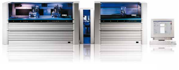
COBAS® AmpliPrep / COBAS® TaqMan® System